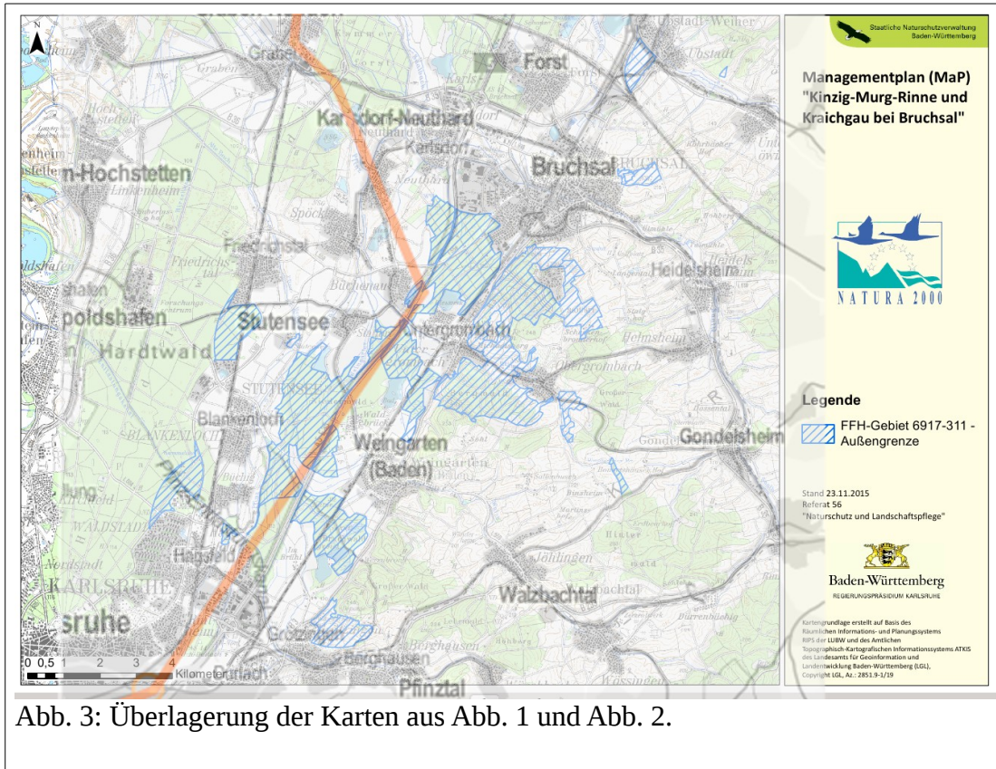
Abb. 3: Überlagerung der Karten aus Abb. 1 und Abb. 2.

Der Entwurf, in dem diese Vorzugstrasse eingezeichnet ist, soll im Herbst 2016 von der Bundesregierung beschlossen werden. Damit würde die Deutsche Bahn AG Planungsrecht auf Basis dieser Trassenführung erhalten.